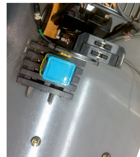
Autarker Stapler mit RFID Ausstattung für Identifizierung und Lokalisierung