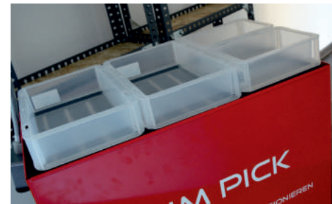
LED-unterstützte Kommissionierbehälter ermöglichen die Auftragszuordnung

Unsere RFID-Technologie erkennt für Sie die richtigen Gang- und Regalpositionen für Ihre Aufträge.