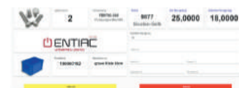
Kommissionier App mit Waagen-Anbindung