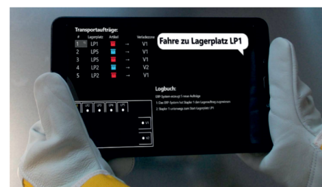
Multi-Order-App für die Artikel und Lagerplatz Darstellung